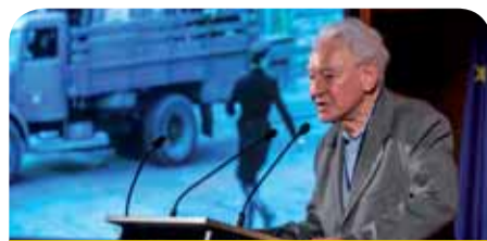
Ocalały z Holokaustu Martin Gray podczas zorganizowanych w EKES-ie obchodów Międzynarodowego Dnia Pamięci o Holokaucie

Z okazji 70. rocznicy wyzwolenia obozu koncentracyjnego Auschwitz EKES uczcił pamięć ofiar Holokaustu, zapraszając ocalałych, świadków i młodzież, by wspólnie oddać się chwili refleksji. Spotkanie zostało zorganizowane we współpracy z Parlamentem Europejskim, Europejskim Centrum Społeczności Żydowskiej (EJCC) oraz organizacją „A Jewish Contribution to an Inclusive Europe” (CEJI).