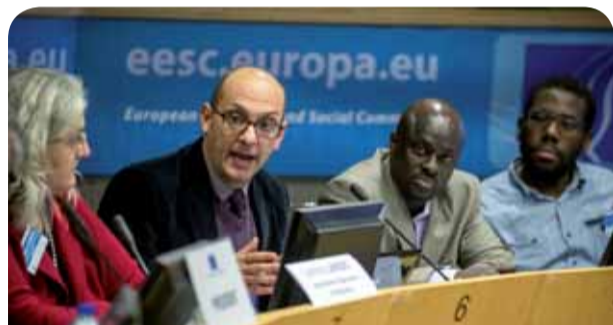
Uczestnicy pierwszego Europejskiego Forum Migracji