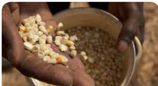
Eliminacja ubóstwa i głodu jednym z celów zrównoważonego rozwoju

Ponadto 20 października 2014 r. odbyło się wspólne posiedzenie Sekcji REX EKES-u i CMRZ, na którym opraco-